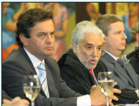
Em seu discurso de posse, o Presidente Wanderley Ávila disse que vai investir na agilização, eficácia e transparência dos atos do TCE