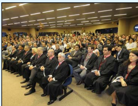
Na primeira fila do auditório lotado, os conselheiros e auditores da Corte de Contas mineira e, na segunda, os procuradores do MP junto ao TCE.