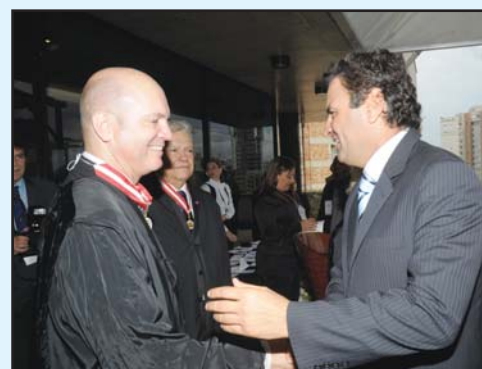
... e pelo Vice-Presidente Antônio Carlos Andrada