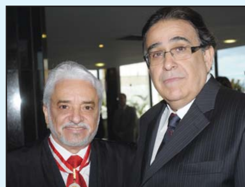
...e o Presidente da Assembléia Legislativa, Alberto Pinto Coelho.