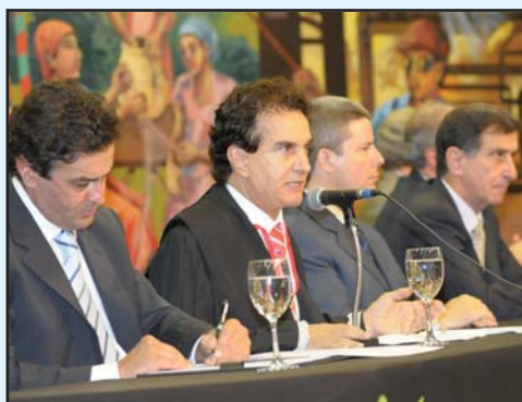
O então Presidente Elmo Braz destacou os avanços alcançados pelo TCE em seu discurso de transmissão do cargo.