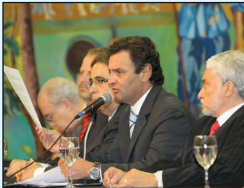
O Governador Aécio Neves enfatizou a importância do Tribunal de Contas no controle do dinheiro público.